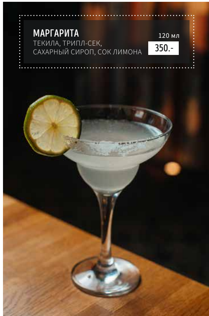
МАРГАРИТА ТЕКИЛА, ТРИПЛ-СЕК, САХАРНЫЙ СИРОП, СОК ЛИМОНА