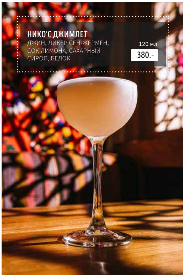
НИКО'С ДЖИМЛЕТ ДЖИН, ЛИКЕР СЕН-ЖЕРМЕН, СОК ЛИМОНА, САХАРНЫЙ СИРОП, БЕЛОК