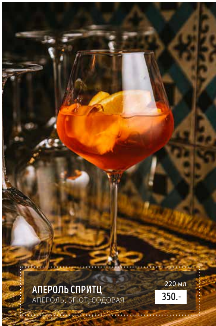
АПЕРОЛЬ СПРИТЦ АПЕРОЛЬ, БРЮТ, СОДОВАЯ