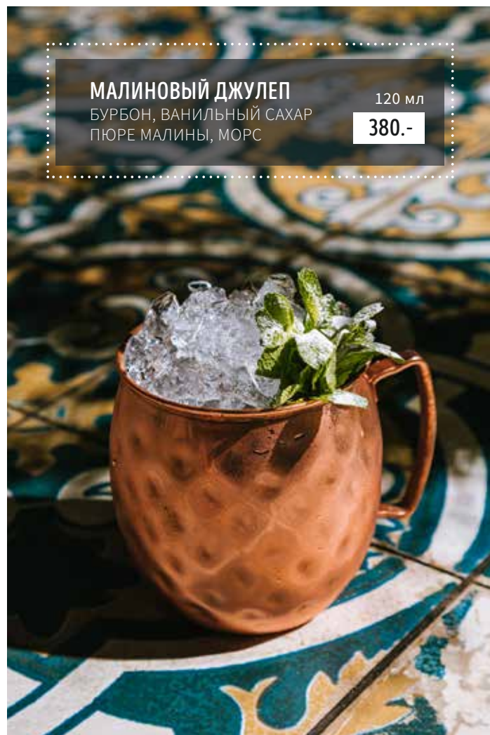
МАЛИНОВЫЙ ДЖУЛЕП БУРБОН, ВАНИЛЬНЫЙ САХАР ПЮРЕ МАЛИНЫ, МОРС